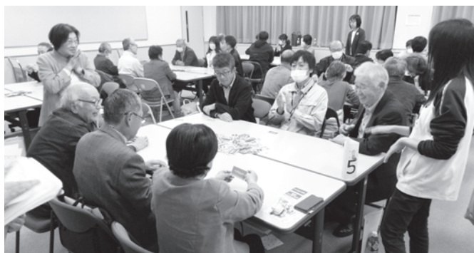
「支え合いの地域づくり勉強会」での助け合い体験ゲームの様子