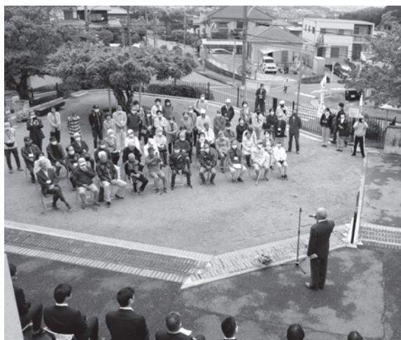
2023年5月、みんなの思いで立ち上がった「支えあい南風流街南ヶ丘」の発足式

活動は、当初から計画していた移動支援に加えて、要望が多かった移動以外の生活支援、そして住民同士が交流できるように、集いの場も市の補助を活用しながら実施することにした。こうして地域の人たちの期待を受け、「支えあい南風流街南ヶ丘」は23年5月8日、発足式を迎えた。