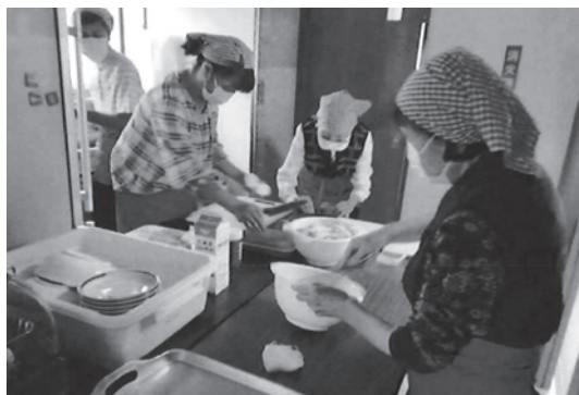
ボランティアの皆さんが調理

今回の助成金は、炊飯器や食器乾燥機等の調理器具や食器やトレイ等の備品・消耗品、チラシ作成などに使用しました。赤字スタートになったものの、「自分だけではこんなに作れない」「茶葉で入れたお茶はおいしい」など喜びの声が多数寄せられているということです。将来、他地域の人でも自由に参加できる形を目指しています、と報告をいただきました。