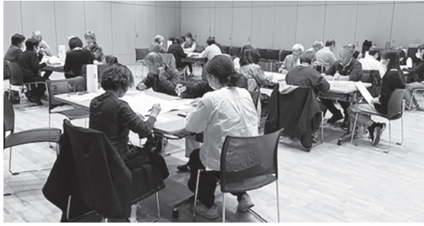
戸田市地域ケア圏域会議のグループワークの様子