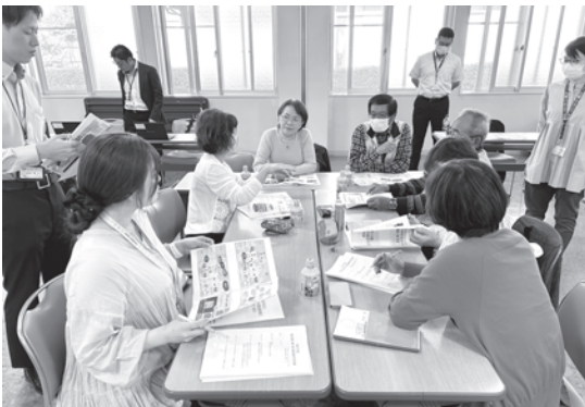
東彼杵町で行われた第1層・第2層（2圏域）の合同会議

財団からは「誰もがいきいきと地域と繋がりながら暮らし続けられるために、どう取り組みればよいか考え