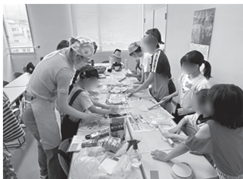
6月の料理教室の様子

「学生団体スピカ」は、当該地域に子どもの居場所づくりをしている団体がなかったことから、当時の高校生が中心となつて2022年に設立。近年の報道等により定着した「貧困世帯の支援場所」という子ども食堂のネガティブなイメージを払拭し、すべての子どもたちが気軽に立ち寄り食事や勉強、遊びを楽しめる居場所を形成しようと、神戸市長田区で月1回、無償（高校生以上300円）で学習支援と昼食を提供する子ども食堂を開催してきました。高校生や大学生という小中学生と比較的近い年齢の学生が運営することで、子どもたちが気軽に立ち寄り、食事や勉強、遊びを楽しめる居場所をつくってきました。