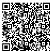
財団ホームページ内 基金関連ページ