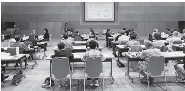
福井県「生活支援コーディネーター養成全体研修会」の様子

話し合う活動は移動支援以外も選択可能としていたが、全グループが移動支援を選択していた。グループワー