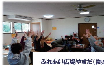
ふれあい広場やすだ（拠点の居場所）