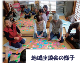
地域座談会の様子