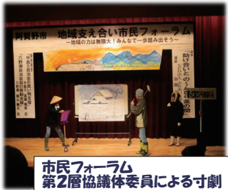
市民フォーラム 第2層協議体委員による寸劇