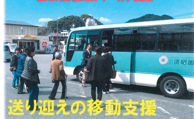
社会福祉法人 済昭園