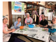
座りながら皮むき