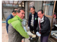
男性陣はきりたんぼ