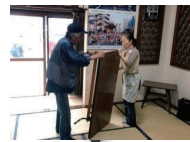
テーブルも参加者で