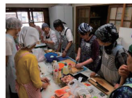
調理法のレクチャー