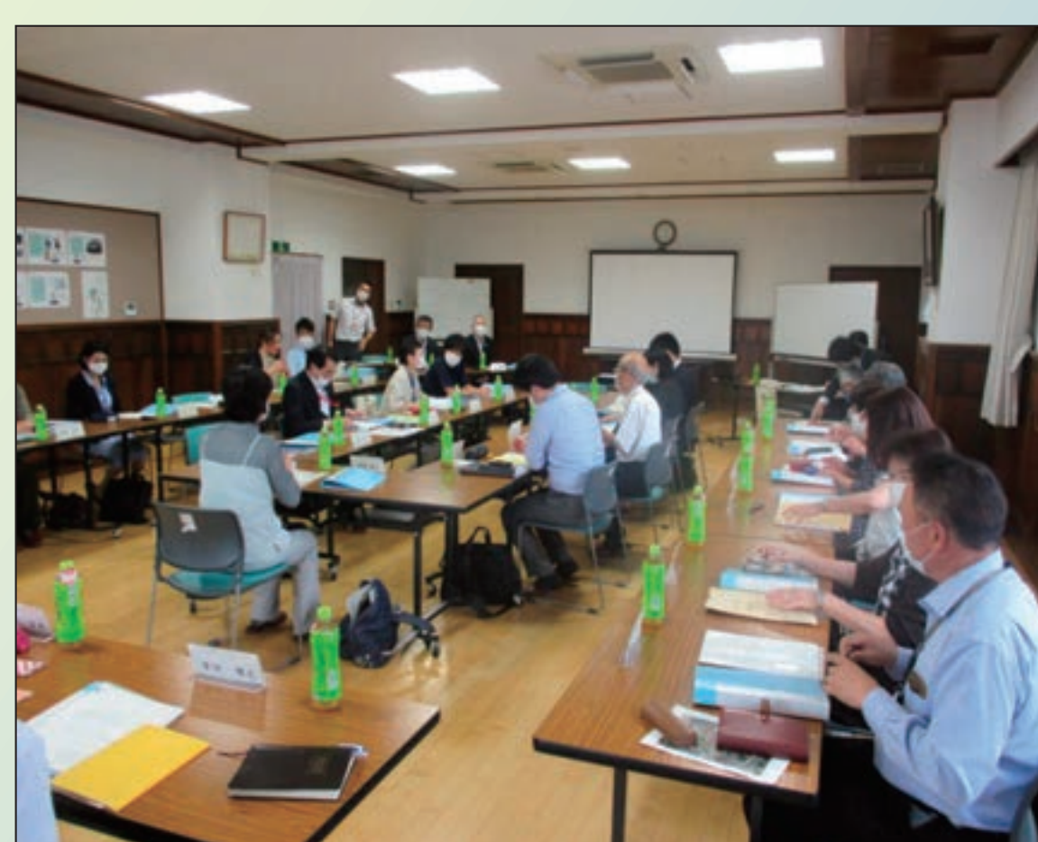
第1層協議体推進会議