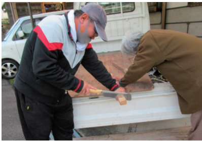
依頼者も、できることで活動に参加する