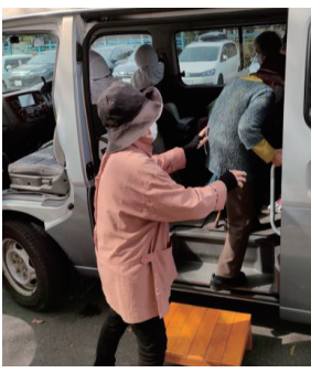
定時巡回の買い物バス始動