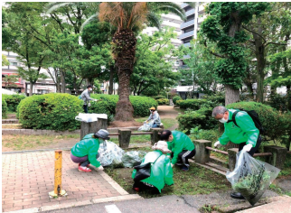
公園の清掃ボランティア活動♪

財団本部事業のテーマである「フレイル予防」を健生おかやまも共有協働しつつ健康寿命延伸を目指し取り組んでいる 人生100年時代にふさわしい「長い老いのステージをどう生きるか」について老いの義務教育を目指し今後の方向性を模索中