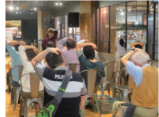
ツボストレッチ、ツボ押し、人気！