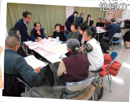
平成30年11月14日～平成31年1月17日 地域のつながりを考える学習会を開催