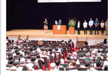
平成30年10月9日 地域のつながりを考える市民フォーラムを開催