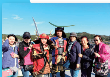
を助け隊×外国人向けツアー