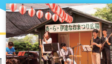
を助け隊×道の駅×おまつり