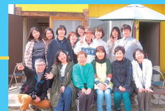
地域外の若者×ごはん会