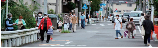
9月5日 防災ウォーク

明けない夜はない、と信じ、活動が困難な時期も皆様のご支援をいただき、感染症対策をし、身近に必要な活動を工夫して続けてきました。自治会の「ふれあい・安心・たすけあい」がある地域づくりの取り組みを紹介いたします。