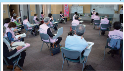
大同生命厚生事業団「シニアボランティア活動助成」を活用